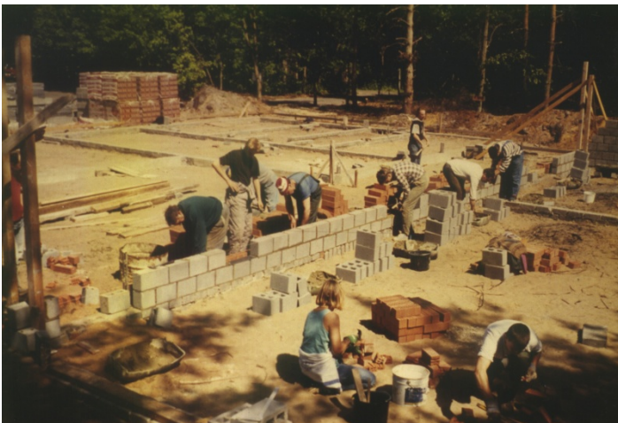
Een foto van één van de vele bouwkampen